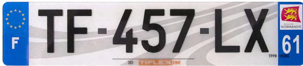
3D 520x110 avec raison sociale

Produit haut de gamme en plastique, la plaque 3D innove en proposant une impression de relief sur une surface plane. Une solution plastique pour offrir l'excellence à vos clients en valorisant votre raison sociale.