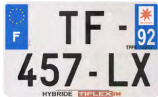
Hybride 210x130 avec raison sociale