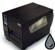
Imprimante Thermique Format auto