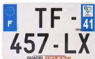
Quadri 210x130 avec raison sociale