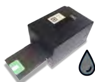
Imprimante Thermique Format auto