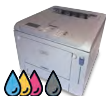
Imprimante Laser Tous formats