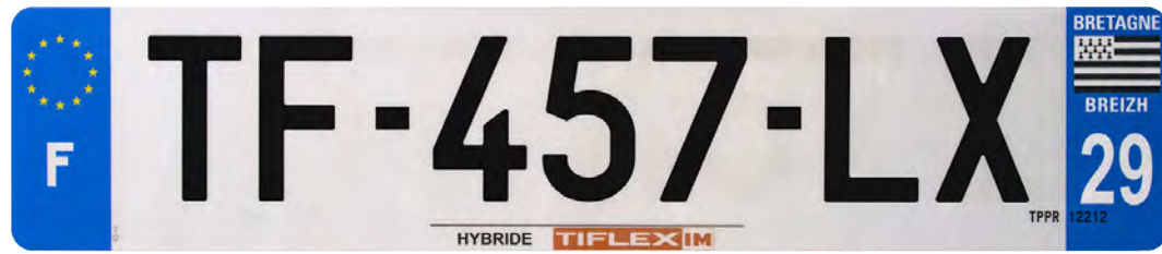
Hybride 520x110 avec raison sociale