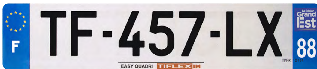
Easy Quadri 520x110 avec raison sociale