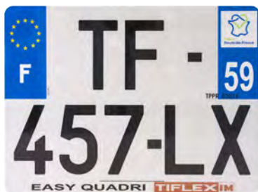
Easy Quadri 275x200 avec raison sociale