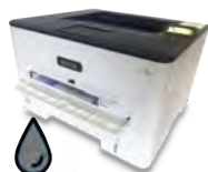
Imprimante Laser Format carré/moto