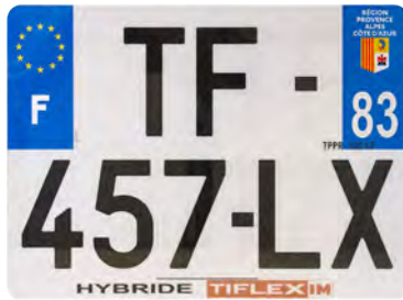
Hybride 275x200 avec raison sociale