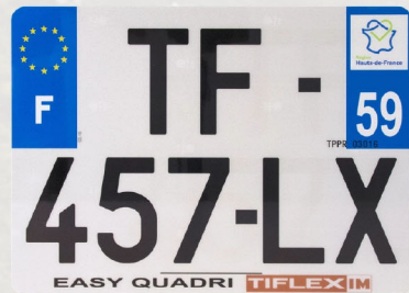
Easy Quadri 275x200 avec raison sociale