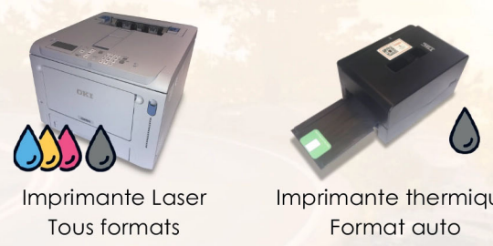
Imprimante Laser Tous formats