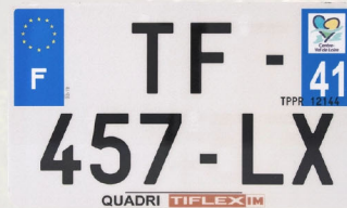
Quadri 210x130 avec raison sociale