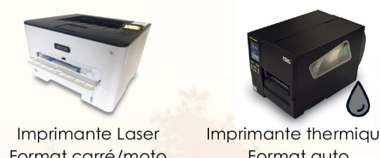
Imprimante Laser Format carré/moto