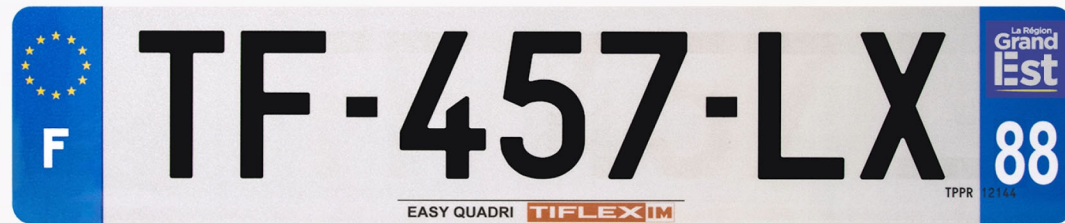
Easy Quadri 520x110 avec raison sociale

Immatriculation simple, rapide et qualitative