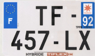
Hybride 210x130 avec raison sociale