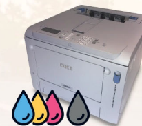
Imprimante Laser Tous formats