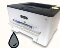
Imprimante Laser Format carré/moto