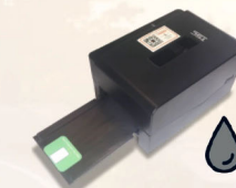
Imprimante Thermique Format auto