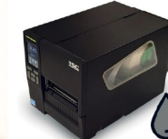
Imprimante Thermique Format auto