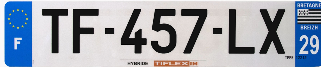
Hybride 520x110 avec raison sociale

Immatriculation simple, rapide et qualitative