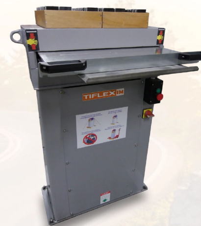
Presse Hydraulique Frappe Unique Frontale