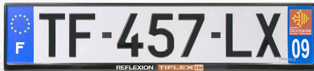
Réflexion 520x120 avec raison sociale