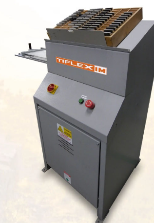
Presse Hydraulique Frappe Unique Latérale